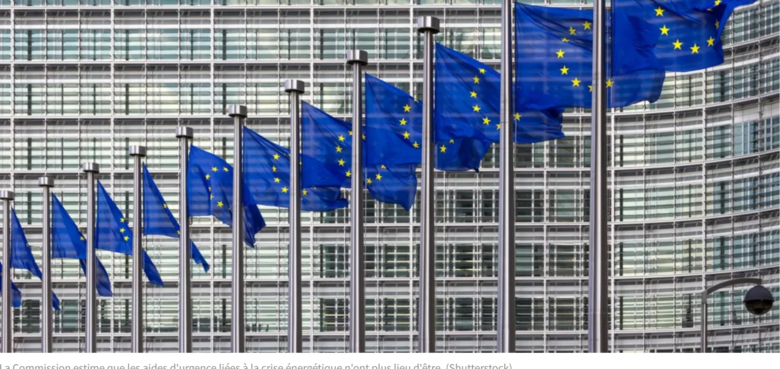
La Commission estime que les aides d'urgence liées à la crise énergétique n'ont plus lieu d'être.

Particulier ou entreprise : des offres adaptées à votre besoin Je m'abonne