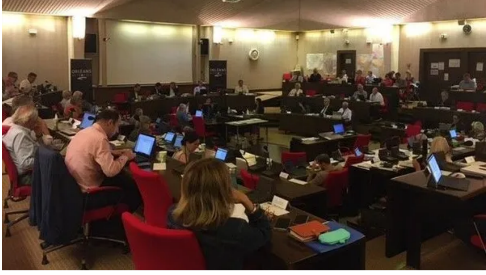
La création de la taxe GEMAPI dans la métropole d'Orléans a été adoptée par 47 voix pour, 7 contre et 28 abstentions

Ce nouvel impôt, c'est la taxe GEMAPI . Comprenez : "Gestion des milieux aquatiques et prévention des inondations". Cette compétence a été en fait transférée par l'État aux intercommunalités par une loi datant de 2014, avec une entrée en vigueur progressive. Cela inclut notamment l'entretien des digues de Loire , dont le coût annuel sur la métropole d'Orléans est estimé à un million d'euros.