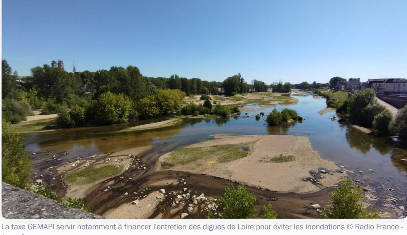
La taxe GEMAPI servira notamment à financer l'entretien des digues de Loire pour éviter les inondations

La décision a été votée lors du dernier conseil métropolitain, le 28 septembre. La métropole d'Orléans va instaurer l'an prochain une nouvelle taxe, qui pèsera autant sur les propriétaires que sur les entreprises , pour financer la politique de prévention des inondations.